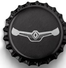
(Arte referencial de tapa)